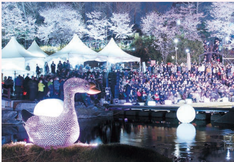
※추후 일정과 내용은 변동될 수 있습니다.

개막 3.29(금) 야외조각전 3.29(금)~4.28(일) 운영장소 양재천 수변무대 일대(영동1교~2교 구간) 내용 서초뮤직페스티벌, 불꽃쇼, 서초 야외 시네마 등 문의 서초문화원 ☎02.2155.8607