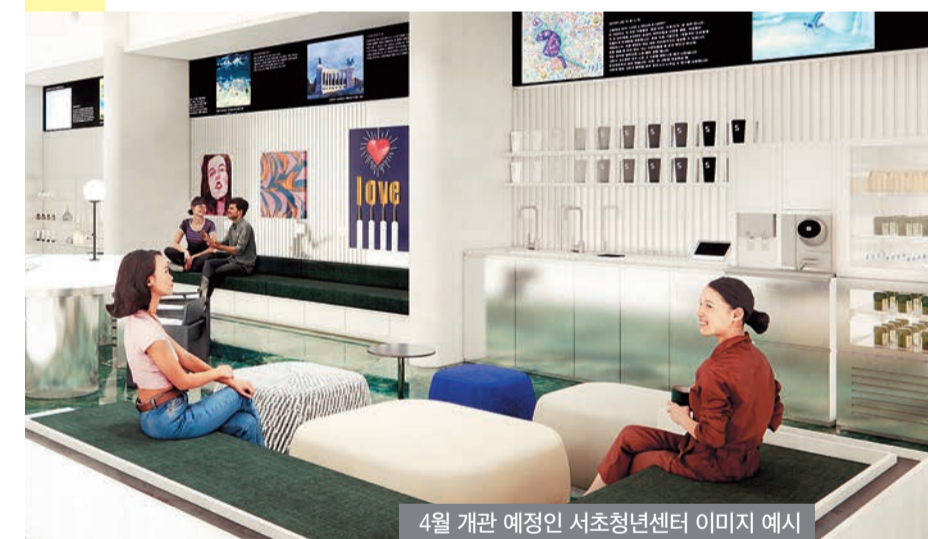
4월 개관 예정인 서초청년센터 이미지 예시