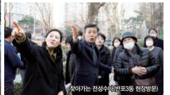
찾아가는 전성수다(반포3동 현장방문)