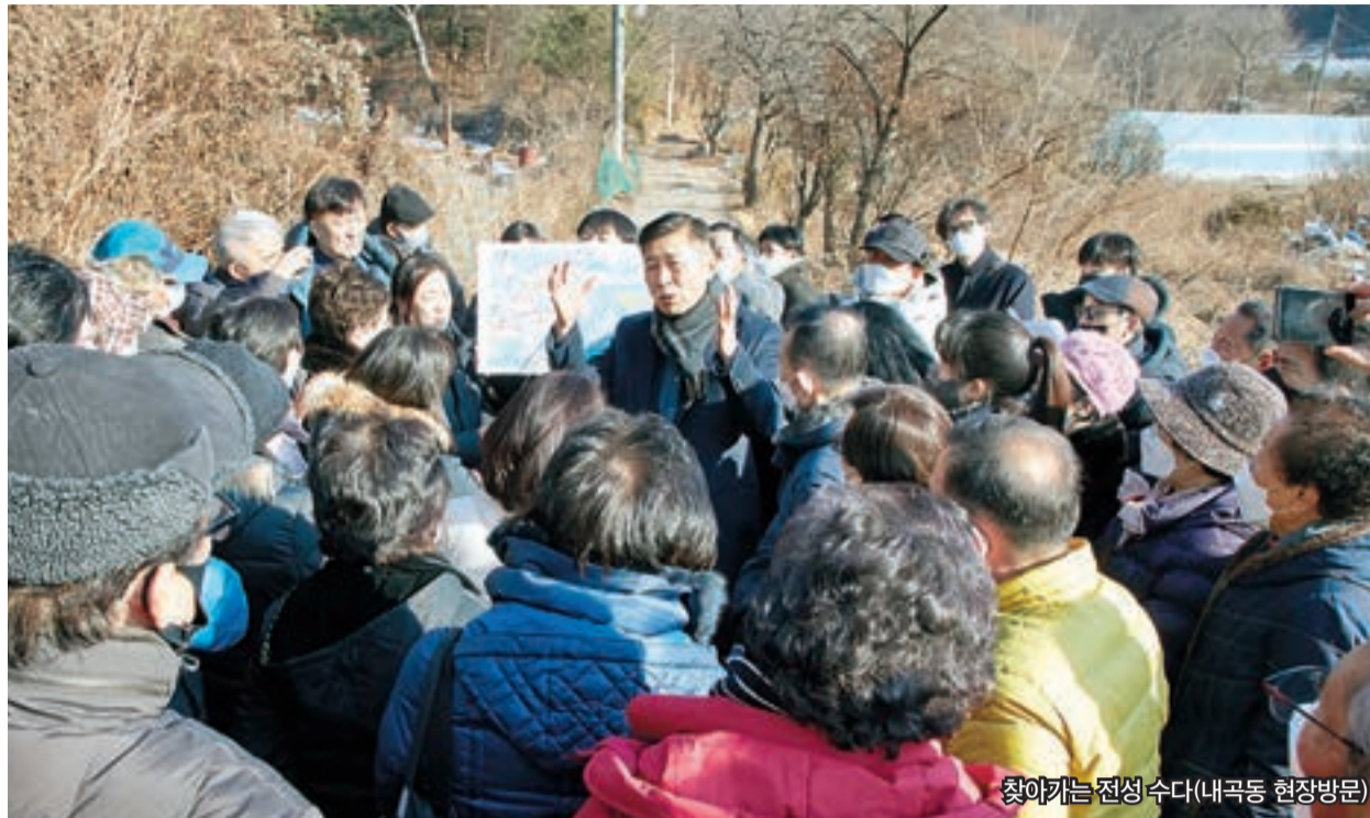
찾아가는 전성수다(내곡동 현장방문)