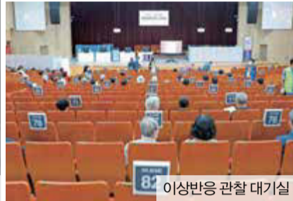
이상반응 관찰 대기실