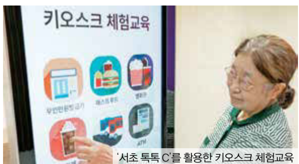
‘서초 톡톡 C’를 활용한 키오스크 체험교육