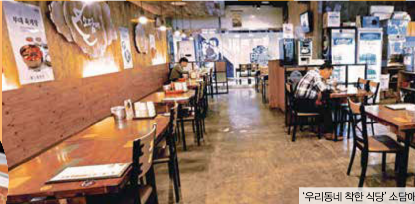
‘우리동네 착한 식당’ 소담애 교보타워점

“눈치보지 말고 와줘” 급식카드 보여주면 따뜻한 무료식사 제공 훈훈한 감동주는 식당