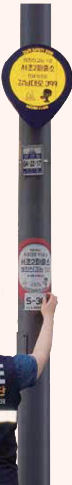
강남역 세이프티존 플리스팟-가까운 파출소 및 신고위치 안내