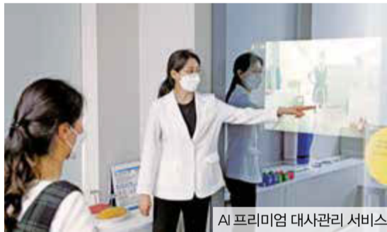
AI 프리미엄 대서관리 서비스

서초 스마트시니어가 즐거움과 여유로 꽉 찬 하루를 보낼 수 있는 비결, 서초구의 스마트한 효도행정을 소개한다.