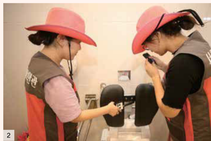
1. 서리풀 보디가드 안전고리 설치 지원 2. 몰카보안관의 화장실 몰카 점검 3. 스카우트 반딧불이와 함께하는 귀가