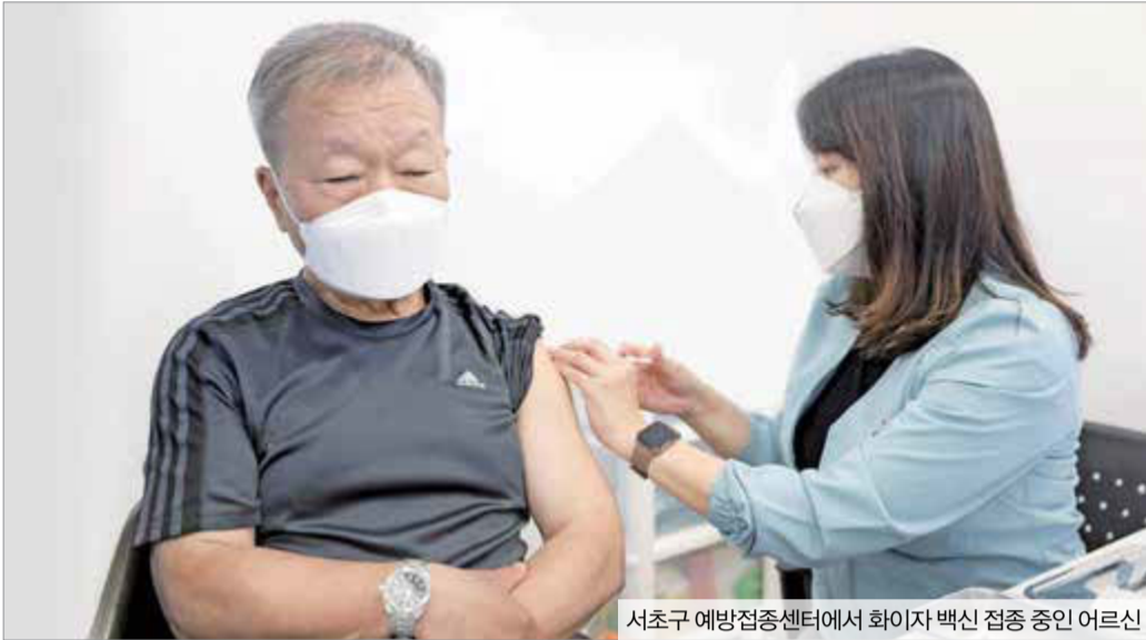
서초구 예방접종센터에서 화이자 백신 접종 중인 어르신