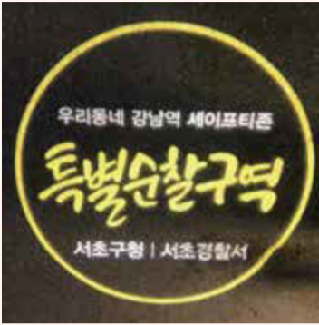
강남역 세이프티존을 알리는 고보조명이 야간 길거리에 빛을 밝힌다.