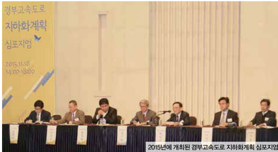
2015년에 개최된 경부고속도로 지하화계획 심포지엄