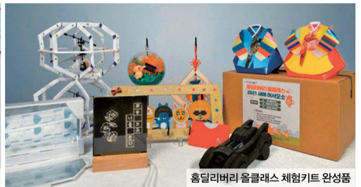
홈딜리버리 올클래스 체험키트 완성품