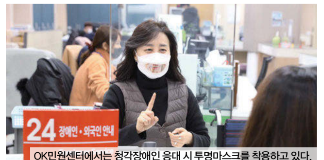
OK민원센터에서는 청각장애인 응대 시 투명마스크를 착용하고 있다.