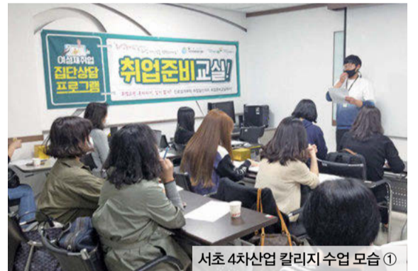
서초 4차산업 칼리지 수업 모습 ①

현재 서초구는 AI·빅데이터 등 4차산업 관련 기술에 대해 기초부터 심화과정까지 배울 수 있는 서초 AI 칼리지 과정을 모집하고 있다. 3월부터 6개월 과정으로 운영 예정이며 교육비는 전액 무료다.