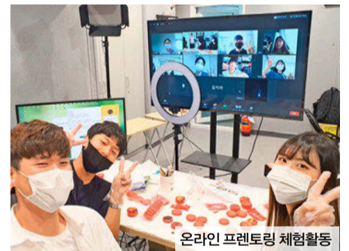
온라인 프렌토링 체험활동

기아 본사 임직원 봉사단과 연계한 활동 ‘동행 멘토링’도 활발히 추진됐다. 멘토 대학생과 멘티 청소년에게 관심분야