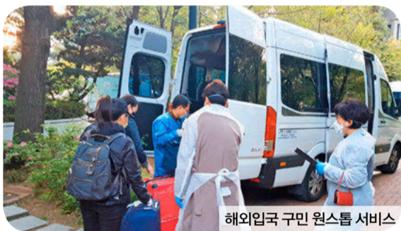
해외입국 구민 원스톱 서비스