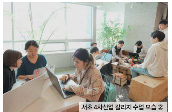
서초 4차산업 칼리지 수업 모습 ②