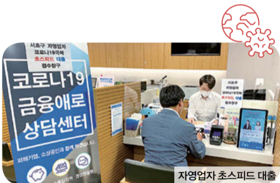
자영업자 초스피드 대출